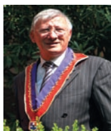
André Fournet Président International

Enfin je n'oublierai pas de remercier le Bottin Gourmand qui dans sa nouvelle édition 2012 a consacré une page à la présentation de notre nouveau guide annuaire « Le Montagné ».